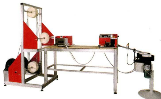
Exemple de ligne de coupe avec dérouleur, tracteur motorisé et bols de lavage

VOTRE PARTENAIRE POUR LE TRAITEMENT DES FILS ELECTRIQUES